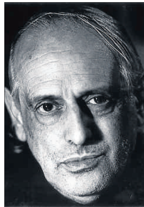
ARXIU BLAI BONET

“Va ser –diu l'estudiosa– un poeta incòmode per a tothom. No escrivia com s'esperava que escrigués. A Mallorca la seva temàtica sexual li impedia ser vist com un continuador del paisatgisme de l'Escola Mallorquina. A Barcelona tampoc no quadrava amb la rígida normalització lingüística i la