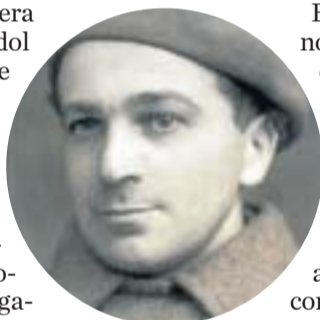
Una imatge de Sygmunt Stein.

A Espanya, però, Stein va patir una altra decepció. Les seves memòries són el crit de ràbia d'un home d'esquerres que se sent enganyat. Al llibre descriu les atrocitats d'André Marty, un dirigent comunista francès. Detalla la corrupció, les borratxeres desenfrenades i les orgies que s'organitzaven entre l'“aristocràcia” de les Brigades. I denuncia el control rus: “L'aparell policíac estava infestat d'agents russos. No hi havia cap institució policial que no estigués controlada per ells”.