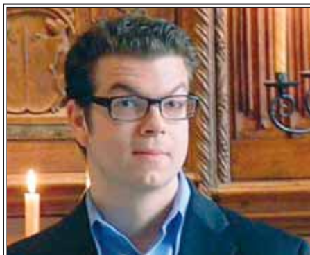
Lerner, poeta i narrador