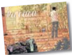
LA CASA PACO ROCA ASTIBERRI 136 PÀG. / 16 €

En el seu nou treball, Paco Roca ens recorda que una casa són quatre parets i un sostre, sí, però sobretot els records i les emocions que evoca en nosaltres. Un vincle material que sempre conserva la memòria dels seus habitants. A La casa , l'autor d' Arrugues persegueix el fantasma del seu pare mort, però en lloc de reconstruir-ne la vida amb exhaustivitat i exhumar les seves virtuts i pecats, com en tanta literatura sorgida del dol, es limita a examinar el que va significar per a ell la segona residència que van aixecar entre tota la família al llarg d'anys, empesos per l'obstinació del pare. Una forma original de comprendre'l i reconciliar-se amb ell que, a mesura que avancen les pàgines, esdevé també una reflexió sobre el pas del temps, voraç i implacable. Aquí és on el talent de Roca com a dibuixant brilla especialment: jugant amb les tonalitats cromàtiques i la composició de pàgina, posant sempre en joc solucions pròpies del llenguatge del còmic. Amb forma de memòria ficcionada, l'obra també funciona com a retrat de l'abisme entre dues generacions: la que va haver de construir un futur amb les pròpies mans i la que un dia no va saber com gestionar l'herència del seu passat. ♦♦