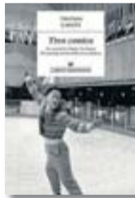
TRES CONTES TRUMAN CAPOTE ANAGRAMA TRADUCCIÓ DE QUIM MONZÓ 512 PÀG. / 27 €

De tant en tant hi ha llibres que cauen a les mans en el moment oportú: són festes de guardar, hi ha empatx de torrons i de novetats sobrerrepresentades als mitjans i, de sobte, un llibret que tot just supera les cent pàgines i que només aplega tres contes fa més llum que totes les bombetes de Nadal del carrer Aragó. No és cap novetat, de fet es tracta d'un autor que necessita poques presentacions: Truman Capote. Sempre se'l relaciona amb l'obra mestra A sang freda i potser menys amb novel·les com L'arpa d'herba o amb els contes, autèntiques perles del gènere. Qualsevol dels tres que s'agrupen aquí –un escrit als anys cinquanta, un altre als seixanta i el tercer, un parell d'anys abans de morir, el 1982– serveix de mostra i d'exemple de moltes coses a la vegada, i to-