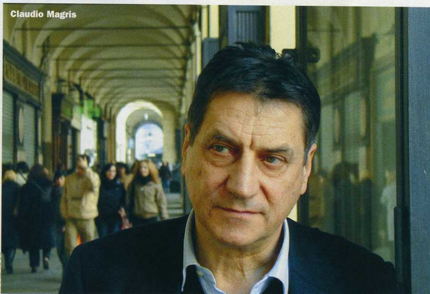
DE BEZIGE BIJ

Un dels articles més interessants és el que Magris va escriure l'any 2007 després de quedar colpit per la revelació de les mentides de l'impostor Enric Marco. "Què passa quan la veritat ve de la boca d'un mentider?", es demana angoixat. Marco, que va arribar a ser president de l'Amical Catalana de Mauthausen sense haver estat mai en un camp de concentració nazi, va acabar admetent la impostura, però no s'ha penedit mai de res i encara ha declarat que ho va fer per una causa justa. Més enllà de constatar que amb la seva actuació Marco ha portat aigua al "verinós molí del negacionisme", Magris defensa per sobre de tot la necessitat contemporània del compromís ètic amb la veritat.