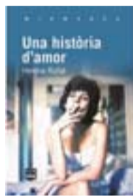
UNA HISTÒRIA D'AMOR HELENA RUFAT EDICIONS DE 1984 156 PÀG. / 16 €

" Una història d'amor pot semblar un títol de novel·la rosa, a primer cop d'ull -admet l'autora-. En el fons és un llibre molt realista i que em sembla bastant actual: entre al-