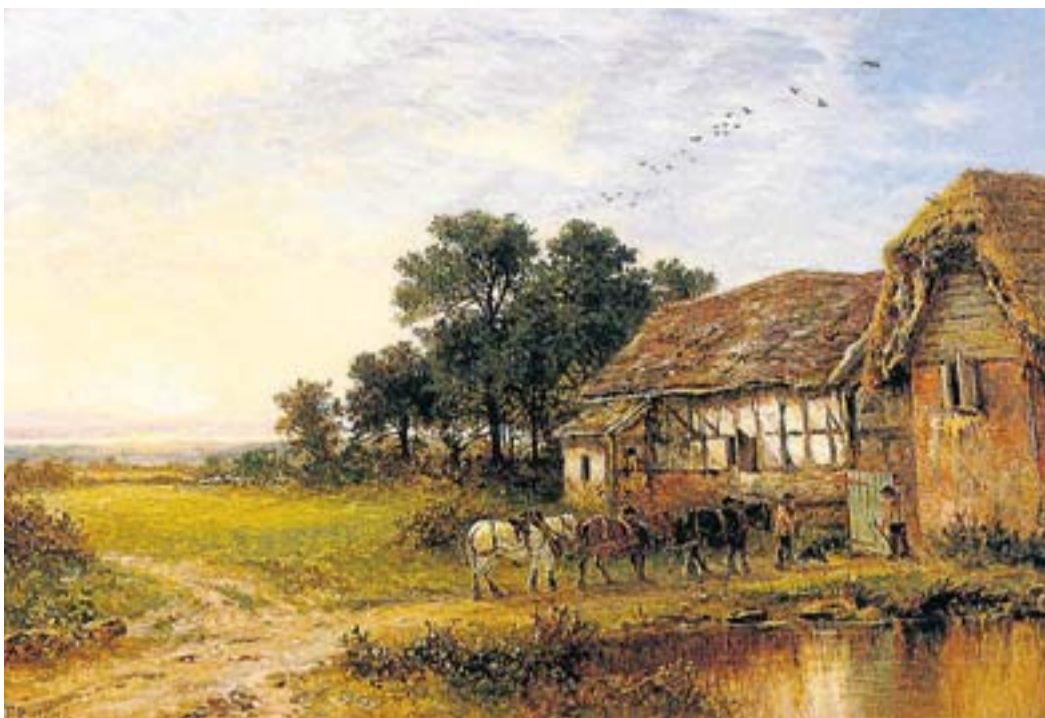
'TORNANT A CASA', OBRA DE BENJAMIN WILLIAMS LEADER.