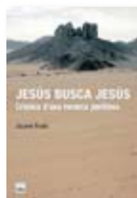
JESÚS BUSCA JESÚS JAUME RODRI EDICIONS DE 1984 234 PÀG. / 18 €

els romans només crucificaven els que s’aixecaven amb armes a la mà. Si aquests són els punts cardinals del relat, subratlem que l’autor té un talent increïble per descabellar la trama i per situar, amb pocs detalls, l’ambient, el soroll, l’aire de cada moment. És un llibre molt ben escrit, de lectura hipnòtica. La construcció del Jesús real, del Jesús històric, que acompanyarà l’autor al llarg dels anys, esdevé perillosa, com diu el subtítol, a mesura que s’aprofundeix. Però això és secundari. És un viatge filosòfic que ens porta a revisar els referents de la cultura occidental, incloent-hi la religió cristiana, vista com un projecte deliberat destinat a vertebrar Europa, és a dir, vista com a instrument de poder i de control. De qui? ¿Dels pares fundadors, que profiten una figura rebel i carismàtica? Al mateix temps que repassem aquesta impostura (o no), repassem