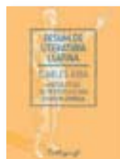
‘Resum de literatura...’ CARLES RIBA Cal·lígraf

L’objectiu de Riba per recollir els grans noms de les lletres llatines en un llibre era “fornir la [informació] indispensable per satisfer una primera curiositat de conjunt”. Des de Plaute fins a Sèneca, la literatura llatina continua tenint un punt d’actualitat gràcies a les traduccions i les lliçons de l’acadèmic.