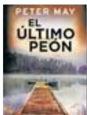
‘El último peón’ PETER MAY Grijalbo

Tot i que una generació sencera intenti amagar un secret, la veritat acaba sent desenterrada. El llac de l’illa de Lewis, al nord d’Escòcia, deixa al descobert la història d’un jove músic local desaparegut. L’inspector Macleod investigarà el cas a l’últim llibre de la trilogia de Peter May.