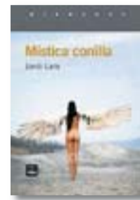
MÍSTICA CONILLA JORDI LARA EDICIONS DE 1984/ ENTRE AMBOS 208 PÀG. / 17,50 €

Scherzo per a bandoneó és una broma borgiana amb Borges, a la nit "im-