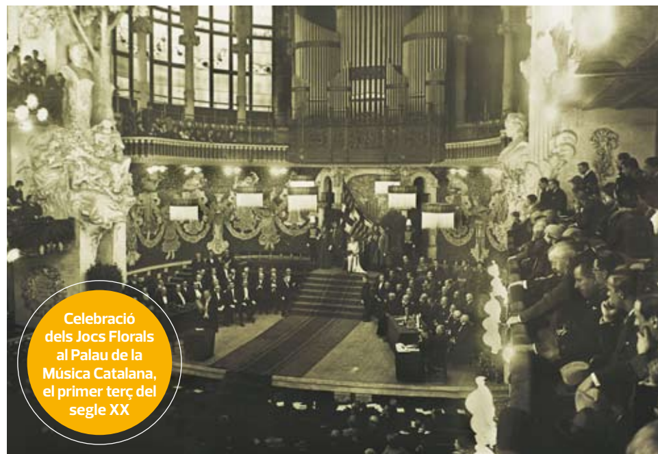
Celebració dels Jocs Florals al Palau de la Música Catalana, el primer terç del segle XX

No sóc gaire donat a aquesta mena de novel·les. Més aviat em fan arrufar el nas. Però, a banda d'un argument que recolora en les qüestions parapsicològiques, la novel·la de Nogué té ingredients atractius. L'estil és sobri, ajustat. L'ampli coneixement musical de l'autora —té el títol de professora de piano al Conservatori