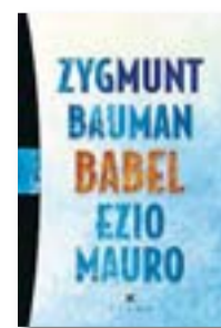
BABEL ZYGUMUNT BAUMAN I EZIO MAURO VIENA TRAD. HELENA LAMUELA 136 PÀG. / 19 €

Per als dialoguistes de Babel , la resposta no es troba en l'autoengany de les grans simplificacions, sinó que comença sent "brutalment sincers amb nosaltres mateixos". Dit d'una altra manera, ens exigeix assumir, en paraules del polític Ivan Krastev, que "protestar dóna poder i votar frustra perquè tombar el govern ja no garanteix que les coses canviïn"; que la bondat o maldat d'una tecnologia depèn del seu ús; que la societat