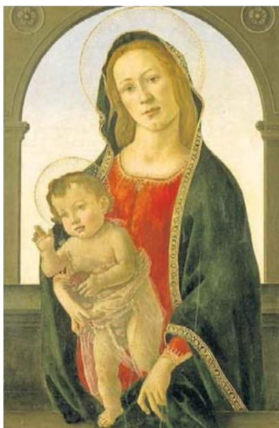
La Verge i Jesús són de Botticelli, el paisatge és fals. MUSEU NACIONAL DE GAL·LES

La pintura va ser cedida per Davies al museu i s'hi ha estat prop de 70 anys, però a partir d'ara serà exposada al públic. Les anàlisis que s'hi han fet, amb modernes tècniques de fotografia d'infrarojos, també revelen que hi ha un rostre masculí ocult amb les marques d'estil de l'artista italià. "Quan vaig veure per